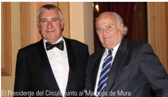
El Presidente del Círculo junto al Marqués de Mura